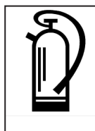
Kohlendioxid CO 2 Typ II